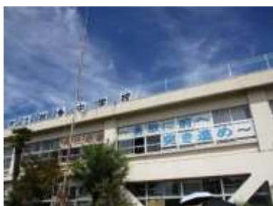
体育大会スローガン

令和5年度第66回体育大会を9月24日(日)に開催いたしました。23日に実施の予定でしたが、前日の降雨で校庭の状況が悪く、1日延期しての開催でした。当日はこの夏続いた猛暑も一段落、とても爽やかな秋晴れとなり、生徒たちは思い切り競技に取り組むことができました。感染症対策でこれまで見合わせてきた団体競技の大ムカデ競走も復活し、各クラスの団結力を高めることができました。生徒の活躍は競技中だけでなく、準備や片付けもともしっかりと取り組んでいました。片付けをしている生徒たちの会話の中から「体育大会、あと5回やりたい！ 毎日やりたい！！」という声が聞こえてきました。生徒たちが行事を通じて達成感を得ることができた素晴らしい経験となったことは、教職員にとっても、とても嬉しいことです。保護者や学校関係者の皆様のご来場も久しぶりに人数制限なしでの実施となり、多くの皆様に御参観いただきました。体育大会成功のためにご協力を頂きました保護者の皆様、近隣の皆様、本当にありがとうございました。