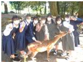
1日目 奈良バス行動 奈良公園

3年生は5月31日（水）から「2泊3日」の予定で関西方面の修学旅行に行って参りました。当初は3日間とも雨模様の予報でしたが、初日の奈良は晴天、2日目の京都班行動も、傘が必要になる場面はありませんでした。3日目は朝から雨で雨量も多く、その中でのタクシー班行動となりました。全員無事京都駅に戻り、新幹線に乗車はしましたが、その後は巻頭にもあるとおり、運転見合わせ、打ち切り、延泊となってしまいました。結果として3泊4日の修学旅行でしたが、本来予定していた3日間の行程は、ほぼ予定通り実施することができました。また、長時間新幹線車内での待機や、延泊にもかかわらず、大きく体調を崩す生徒もいませんでした。保護者の皆様の御理解、またあきる野市教育委員会のご支援等、多くの皆様のご協力をいただき参加者全員無事帰宅することができました。本当にありがとうございました。