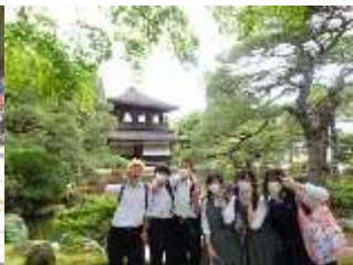
2日目 京都班行動 慈照寺銀閣