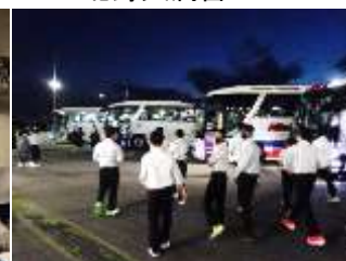
4日目 海老名 S.A. 秋川まであと一歩