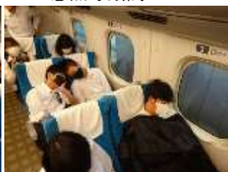
3日目 新幹線車内 待機中