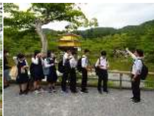
2日目 京都班行動 鹿苑寺金閣