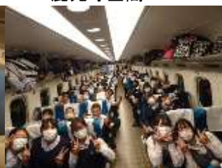
4日目 新幹線車内 間もなく新横浜