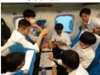
3日目 新幹線車内 待機中