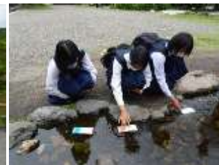
2日目 京都班行動 北野天満宮