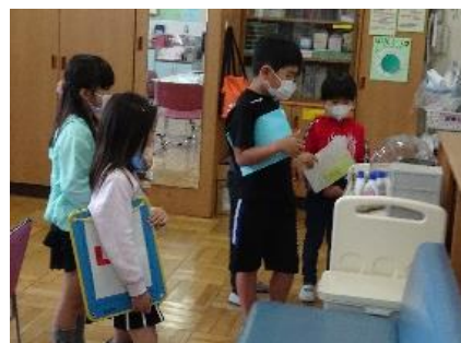
説明を聞いた後で、実際にその教室を見て歩く児童たち

全体協議会では、「写真を選んだ視点や普通教室との相違点、写真の撮影バランス、どの部分を焦点化すべきかなど、事前に確認しておいた方がよかった」という意見も出るなど、低学年児童が活用できる可能性についても話し合い、今後の指導に繋げることができた。