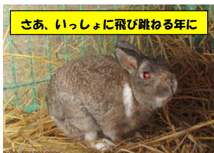
さあ、いっしょに飛び跳ねる年に