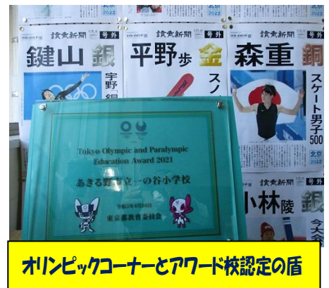
オリンピックコーナーとアワード校認定の盾