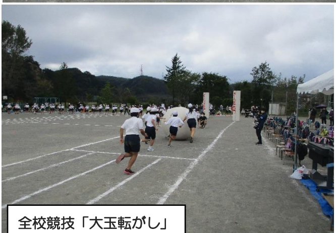
全校競技「大玉転がし」