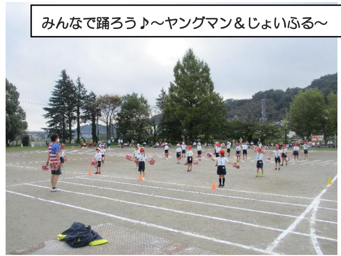
みんなで踊ろう♪～ヤングマン&じょいふる～