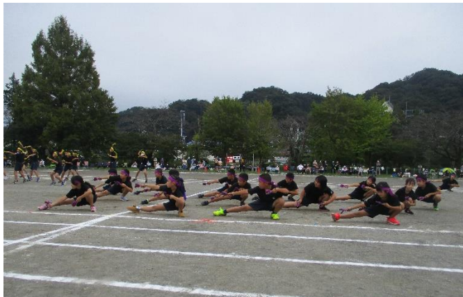
よさこいまつりだ！「さあさ、みんなでどっこいしょ」