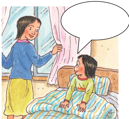
あさ おきた とき