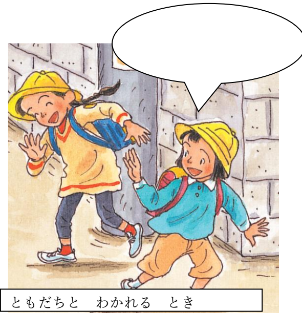
ともだちと わかれる とき