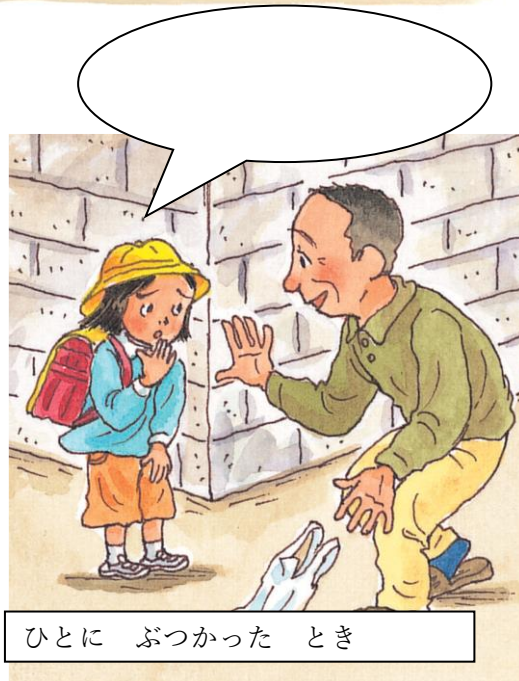
ひとに ぶつかった とき