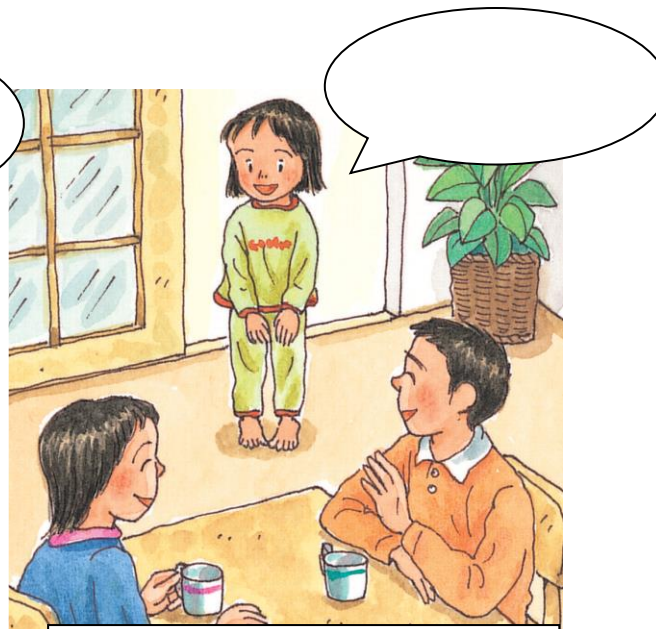
よる ねる とき