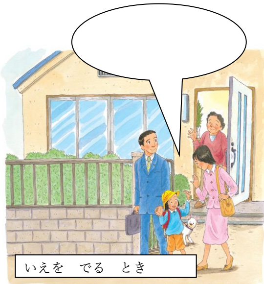
いえを での とき