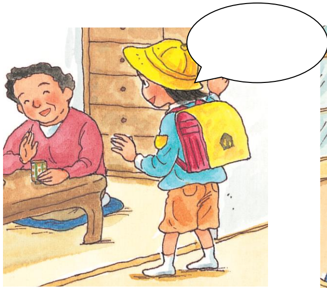
いえに かえった とき