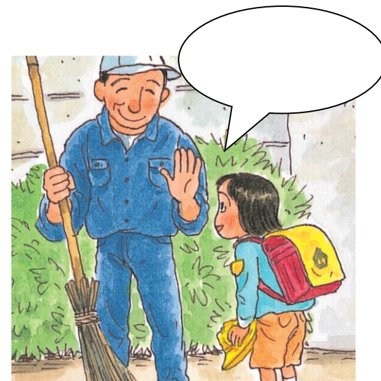
あさ ようむいんさんに あった とき