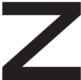
アルファベットのゼット